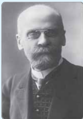
(امیل دورکیم زاده ۱۵ آوریل ۱۸۵۸ درگذشته ۱۵ آوریل ۱۹۱۷)

مثال ۲: و برخی دیگر از جامعه‌شناسان معتقدند، نرخ خودکشی در بعضی از کشورها با سطح رفاه عمومی بالا، بیشتر از برخی جوامع با سطح رفاه و شرایط اقتصادی پایین‌تر است. (نهایی دیدگاه امیل دورکیم، جامعه‌شناس فرانسوی)