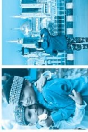
توجه انسان در انجام کنش به معنای آن